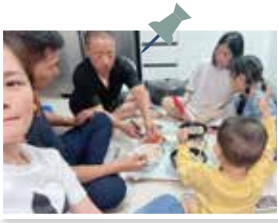
베트남 명절 쫄투 지내기