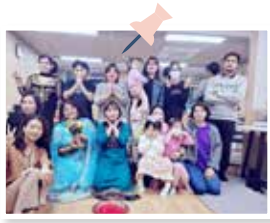
네팔명절 더서이 지내기