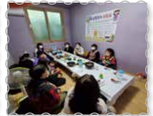
창업결혼이민자 경험 나눔