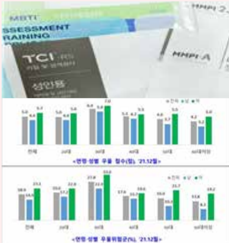
보건복지부, 2021년 코로나19 국민정신건강 실태조사