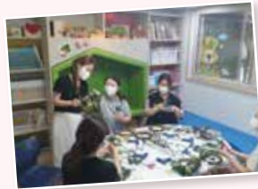
품앗이 활동가 양성교육